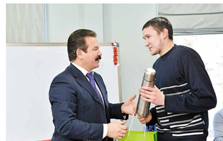
Подарок автору лучшего вопроса

касающаяся рационализаторского движения, выносилась на обсуждение. Однако сейчас она несколько заглохла. Понятно, что существуют различного рода бюрократические проволочки, но от них никуда не уйти. Работа над рацпредложениями сложна и требует максимального изучения технико-экономических характеристик, ведь снести установку несложно, другой вопрос, как сделать так, чтобы она после усовершенствования давала более качественный результат. Кроме того, не стоит забывать о главном условии – реализация рацпредложения должна приносить обязательный экономический эффект. Здесь нужна реакция с мест: скажите, какие препятствия, связанные с внедрением рацпредложений существуют, и мы постараемся их устранить.