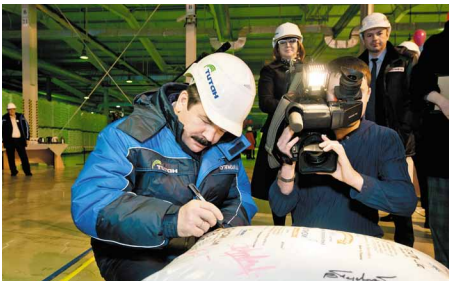
Автограф на память