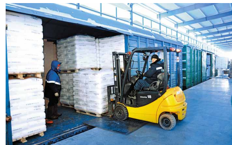
Грузим готовую продукцию