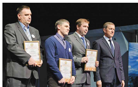
Равнение на лучших!