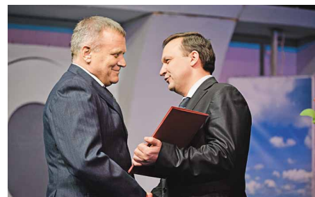
Награда наша героя