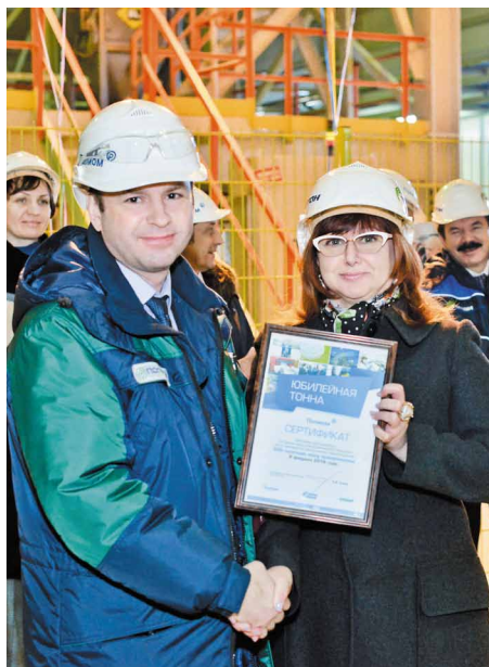
Есть 500 000 тонн!

Поздравляю Вас и трудовой коллектив завода со знаменательным событием – выпуском 500-тысячной тонны полипропилена. Ваше предприятие – одно из самых молодых в регионе. Его открытие в 2013 году стало важным шагом в развитии экономики Омской области и всей отечественной нефтехимии. Сегодня Омский завод полипропилена – это современное производство с высокой степенью экологической защиты, ориентированное не только на российский, но и зарубежные рынки. Уверен, предприятие, занимающее ключевые позиции на отечественном рынке, ждет успешное будущее. Таких производств, как ООО «Полиом», с широким марочным ассортиментом и высокой установочной мощностью в нашей стране должно быть как можно больше. Желаю Вам и Вашим коллегам новых производственных достижений, а предприятию – дальнейшего развития и процветания!