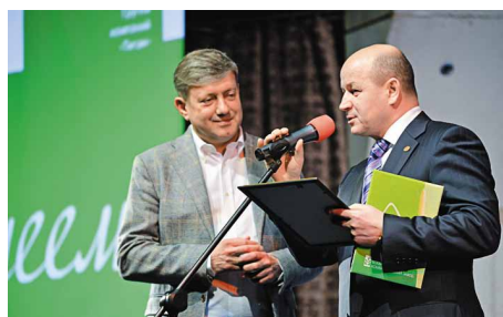
Ответная речь партнерам