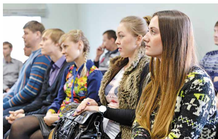
Комиссия слушает докладчика