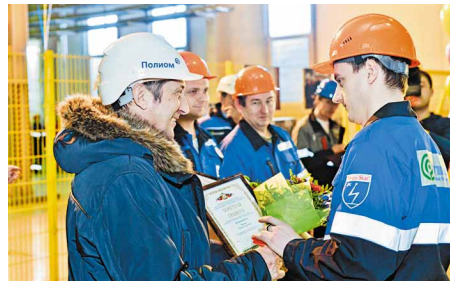
Награды – достойным!