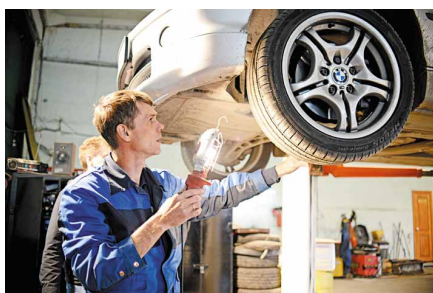
BMW в руках профессионала