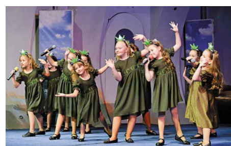
Поют «Русские голоса»