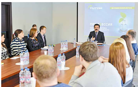
Тише! Идет экзамен