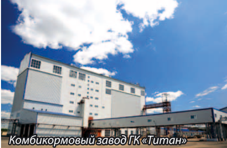
Комбикормовый завод ГК «Титан»

Оборудование для лаборатории комбикормового завода Пушкинский готово к монтажу. На предприятие поступило более ста единиц новой измерительной техники.