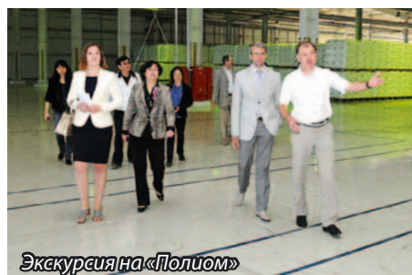
Экскурсия на «Полиом»

14 августа в рамках официального визита в Омск делегация китайского города Фучжоу встретилась с представителями Группы компаний «Титан» и посетила производственную площадку завода «Полиом».