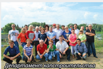
Департамент капитального строительства