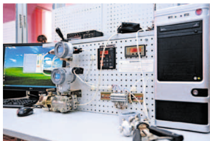
В лаборатории Центра