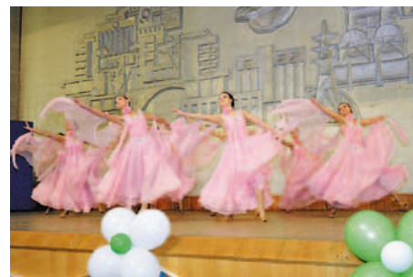
В вихре танца

факт – по уверению молодых людей, их суммарный возраст как раз равен 52 годам. Песенные и танцевальные номера подготовили также ветераны завода.