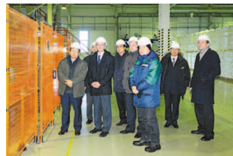
На складе готовой продукции

«Основная цель приезда в Омск – обсудить вопросы, связанные с дальнейшим сотрудничеством в различных секторах бизнеса», – прокомментировал визит в наш регион старший вице-президент Daewoo International