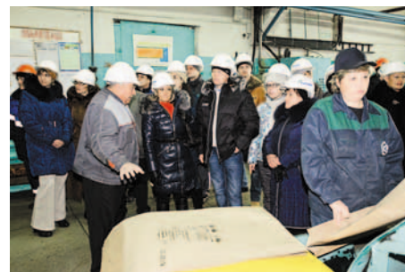
На участке упаковки