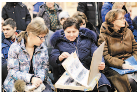
Листая заводские летописи