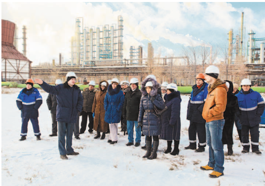
На промышленной площадке