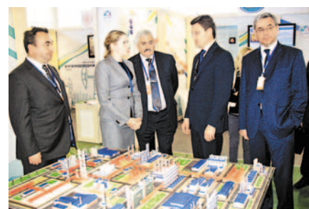
Министр энергетики РФ у стенда ГК «Титан»

На панельной сессии «Евразийская интеграция: взгляд бизнес-сообщества» специалисты ГК «Титан» выступили с докладом «Евразийский агропромышленный кластер как инструмент развития кооперации ЕврАзЭС». В ходе выступления был