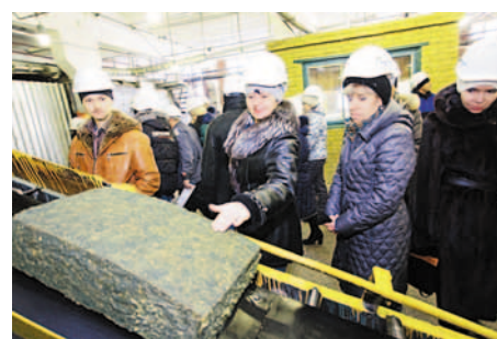
У конвейерной ленты