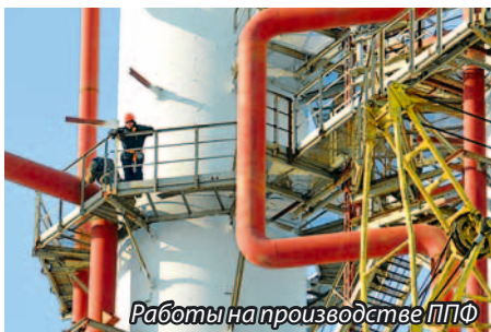
Работы на производстве ППФ