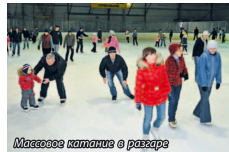
Массовое катание в разгаре

Газета зарегистрирована в Роскомнадзоре Омской обл. Св-во о рег. ПИ№ ТУ–55-00190 от 8 июня 2010 г. Учредитель – ЗАО «ГК «Титан» Адрес издателя: 644040, г. Омск, ул. Нефтезаводская, 53 Адрес редакции: 644035, г. Омск, пр. Губкина, 22, 113 Телефоны: 67-30-10, 14-88, IP 4088 e-mail: element22@titan-omsk.ru