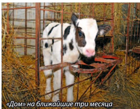
«Дом» на ближайшие три месяца