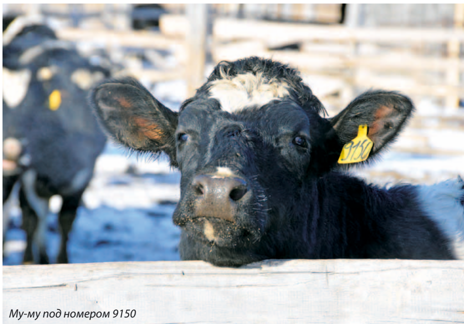
Му-му под номером 9150