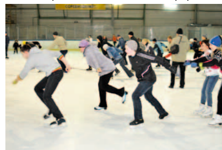
Эстафета на коньках

26 февраля состоялось второе в рамках юбилейного марафона ОАО «Омский каучук» мероприятие – массовое катание на коньках, где приняло участие около ста человек: работников завода и их близких родственников. Подробнее – в ближайшем выпуске газеты «Омский каучук».