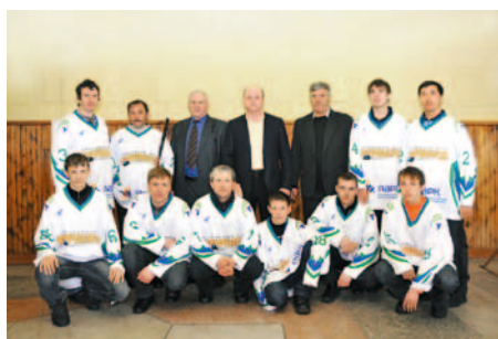
В новой форме к новым победам

3 февраля хоккейная команда Нижнеомского района Омской области получила в подарок от ГК «Титан» десять комплектов спортивной формы.