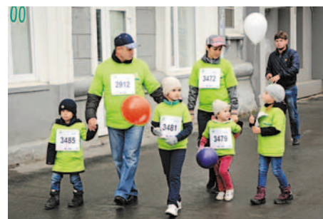
Все на марафон!