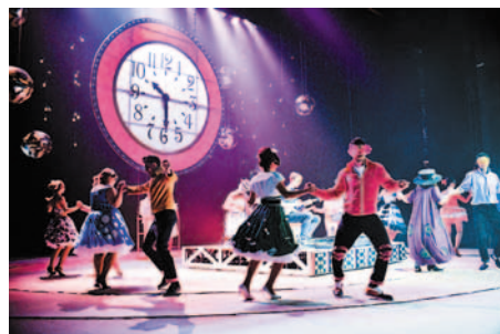
На балу у короля