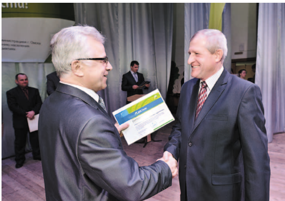
Вручение заслуженных наград