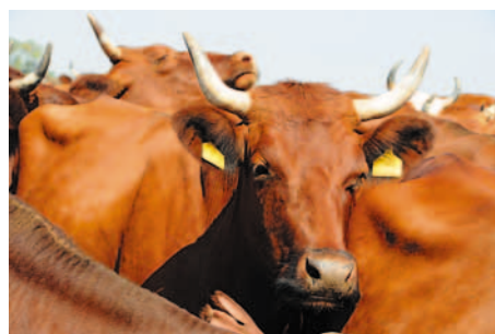
В СП «Сибирь»