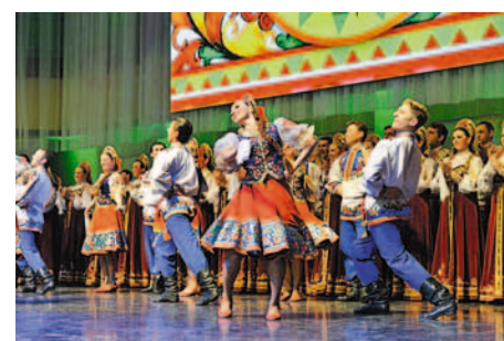
Выступает Омский народный хор