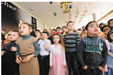
В ожидании чуда