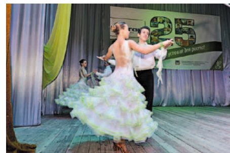
Вальс, вальс, вальс!

природы выдержал серьезный экзамен на прочность».