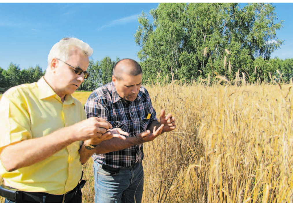
В СП «Иртыш» (Горьковский район)