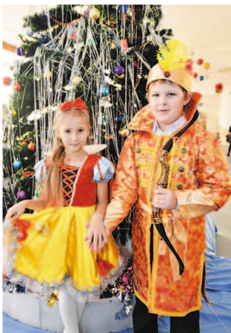
Иван-царевич и принцесса