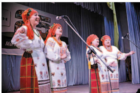
Выступление народного хора