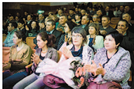
В зрительном зале