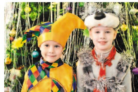
Скоморох и кот Матроскин