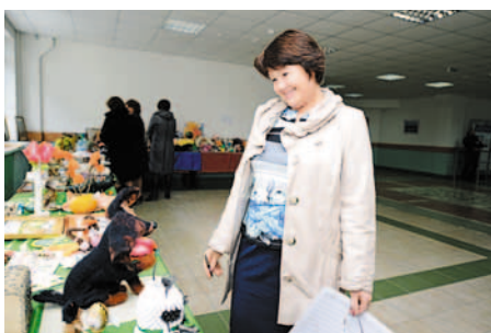
На выставке «Своими руками»