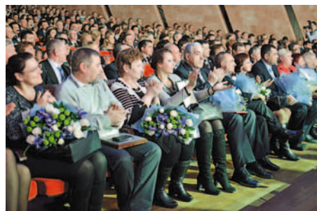
Зрители и награжденные