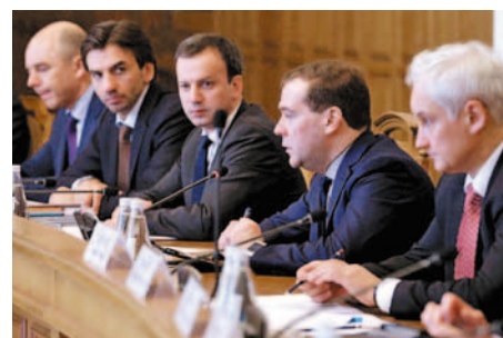
Заседание в Белгороде

21. Конкурс рацпредложений В ГК «Титан» прошел первый корпоративный конкурс рацпредложений. Первое место в конкурсе заняла группа из шести авторов ОАО «Омский каучук». Внедрение их предложения привело к значительному сокращению количества образования отходов изопропилбензола, а экономический эффект составил более 21 млн рублей.