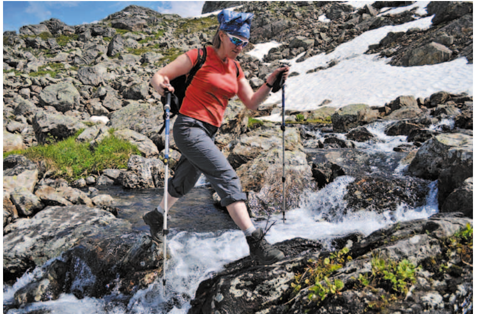
Восточные Саяны: перевал Пятиозерный

Я закончила экономический факультет ОмГАУ – в нашей семье это своего рода традиция. Совершенно не жалею о сделанном тогда выборе: это была хо-