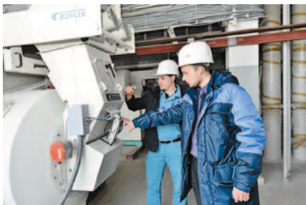
На площадке Комбикормового завода