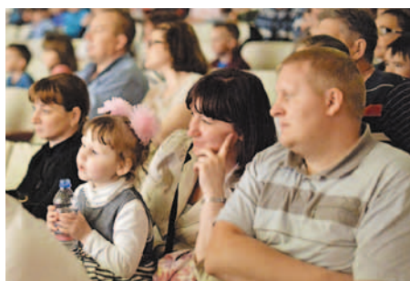
Мальчишки и девчонки, а также их родители

«Ребенок пришел с церемонии награждения довольный и счастливый. Еще бы, ведь получить гран-при в конкур-