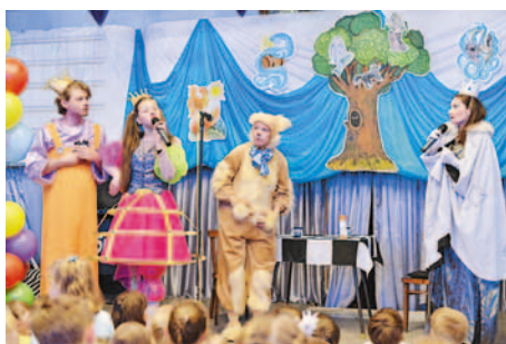
В гостях у сказки