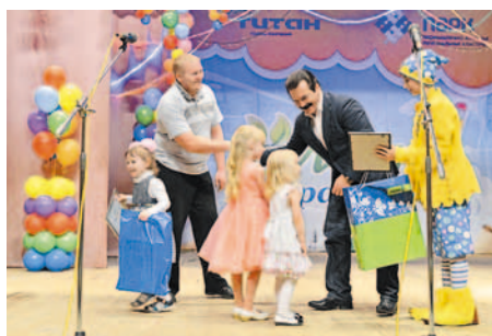
Подарки! Подарки! Подарки!