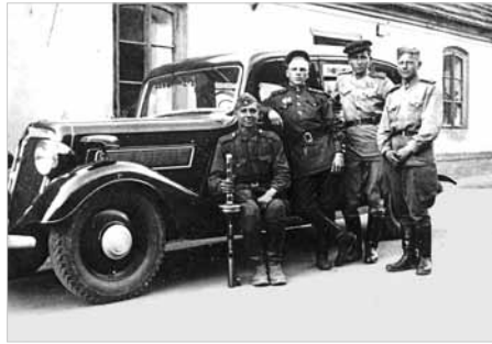
Снимок военных лет. Место и время съемки неизвестно.