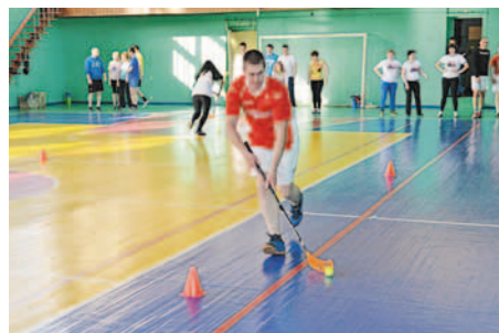
Эстафета ко Дню химика