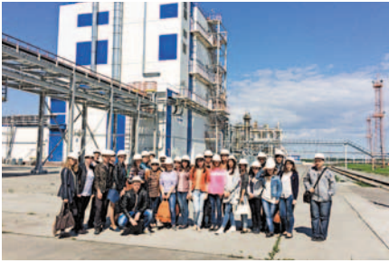
Фото на фоне завода