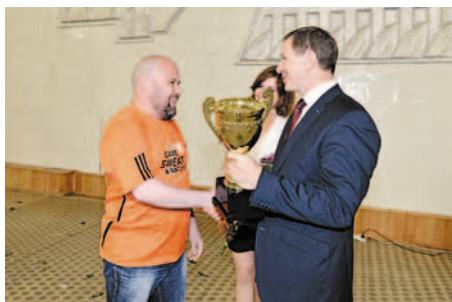
Кубок снова за «Омским каучуком»