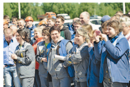
Веселье на «Полиомере»