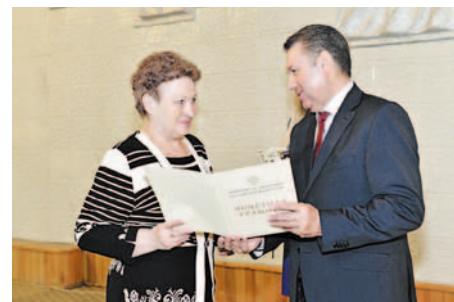
Вручение Почетных грамот Минэнерго РФ

ков завода. Все награжденные получили право посадить свое именованное дерево и положить начало аллее тружеников.