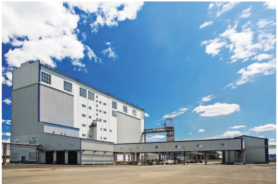
Новый. Высокотехнологичный. Титановский

– На заводе оборудована производственно-технологическая лаборатория, укомплектованная новейшей измерительной техникой, позволяющей проводить исследования на всех этапах. Высокое качество выпускаемых комби-