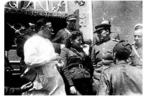
Польша, 1944 год. На заднем плане – человек в иностранной, предположительно, польской военной форме.